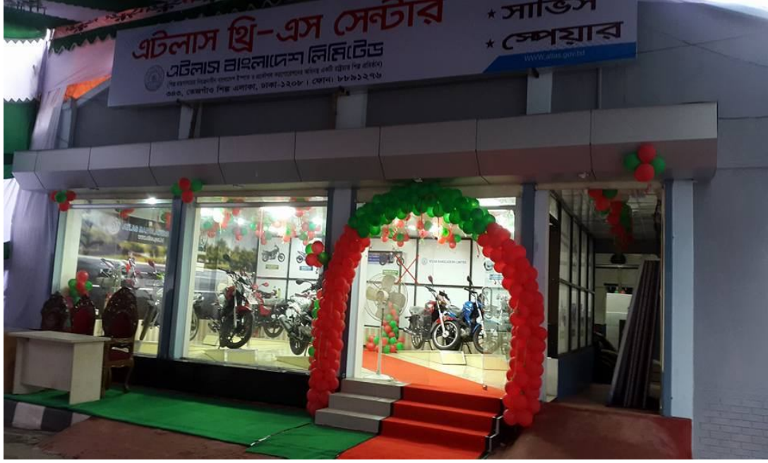
এটলাস বাংলাদেশ লি. এর 3S সার্ভিস সেন্টার

রাজধানীর তেজগাঁও শিল্প এলাকায় অবস্থিত বাংলাদেশ স্টীল অ্যান্ড ইনঞ্জিনিয়ারিং করপোরেশনের (বিএসইসি) আওতাধীন