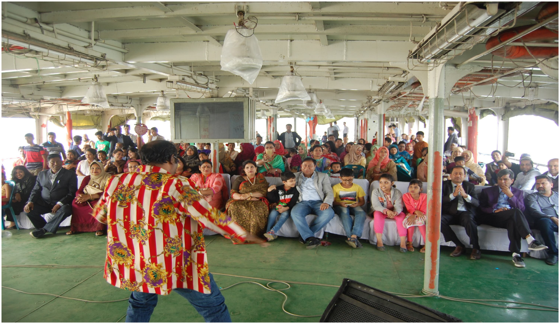
২০১৮ সালে অনুষ্ঠিত বার্ষিক বনভোজনে