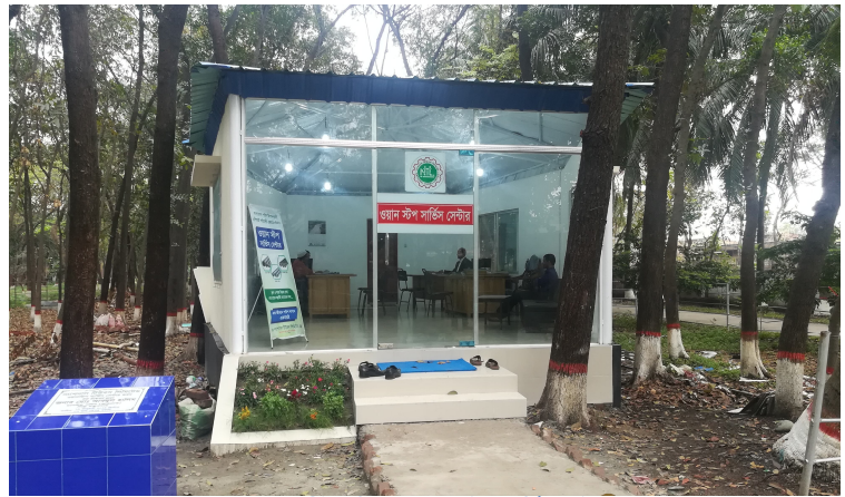
ন্যাশনাল টিউবস লি.-এ ওয়ান স্টপ সার্ভিস সেন্টার

ক্রেতাসাধারণকে সর্বোচ্চ সুবিধা প্রদানে ন্যাশনাল টিউবস লি.-এ ওয়ান স্টপ সার্ভিস চালু করা হয়েছে। পূর্বে তথ্য সংগ্রহ ও উপস্থাপন, প্যাকিং লিস্ট, ভ্যাট চালান, গেইট পাশ ও সরবরাহ চালন ইত্যাদি কাজ সম্পাদনে ক্রেতাকে বিভিন্ন ডেস্কে যেতে হতো। এ কারণে ক্রেতাসাধারণের সময় অপচয় এবং কষ্ট পোহাতে হতো। বর্তমানে ওয়ান স্টপ সার্ভিস চালু হওয়ায় ক্রেতা সরাসরি ওয়ান স্টপ সার্ভিস সেন্টারে যোগাযোগ করবেন। ক্রেতা যদি মূল্য জানতে চান তাহলে তাকে তৎক্ষণিকভাবে মূল্য জানিয়ে দেয়া হবে। তারপর ক্রেতা যে সাইজের যে পরিমাণ মালামাল ক্রয় করতে চান তা স্টকে আছে