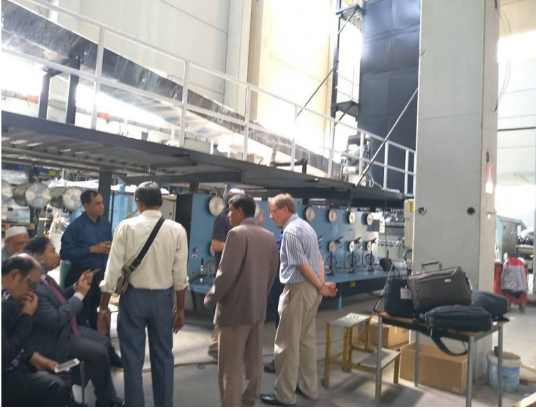
ইতালিস্থ কারখানায় গিয়ে মেশিনের ফ্যাক্টরী একসেপ্টেটস টেস্ট (FAT) সম্পন্ন কার্যক্রম

নিশ্চিত হওয়ার জন্য ইতালিস্থ কারখানায় গিয়ে মেশিনের ফ্যাক্টরী একসেপ্টেটস টেস্ট (FAT) সম্পন্ন করেন।