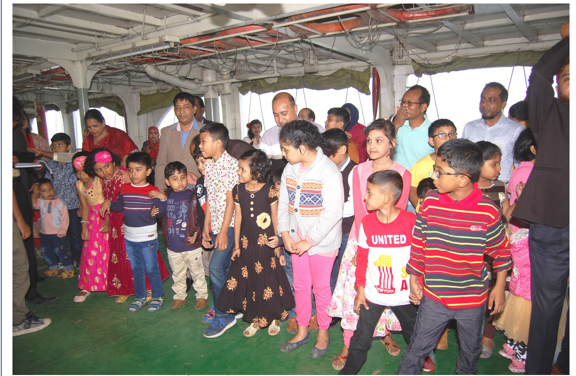
২০১৮ সালে অনুষ্ঠিত বার্ষিক বনভোজনে শিশুরা খেলাধুলায় অংশগ্রহণ করছেন।

শ্রমিক কর্মচারী পোষ্যদের লেখাপড়ার সুবিধা ও শ্রমিক কর্মচারীদের ধর্মীয় কার্যাবলী পালন ও চিন্তাবিনোদনের উদ্দেশ্যে মেধা বৃত্তি চালু, মসজিদ, কল্যান কেন্দ্র ও ক্লাব প্রতিষ্ঠা করা হয়েছে। বিভিন্ন বিজয় দিবস, স্বাধীনতা দিবস অন্যান্য বিশেষ দিনে খেলাধুলা, মিলাদ মাহফিল, ঈদ পূর্ণমিলন, বার্ষিক বনভোজন প্রভৃতি বিনোদনমূলক অনুষ্ঠানের ব্যবস্থা করা হয়। এই সকল কর্মকাণ্ডের মুখ্য উদ্দেশ্য হলো কর্মরত শ্রমিক কর্মচারীদের কাজে উদ্যম ও অনুপ্রেরনা দান।