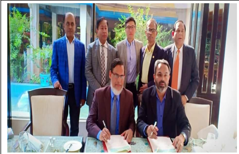
এটলাস বাংলাদেশ লিমিটেড ও টিভিএস অটো বাংলাদেশ লিমিটেড এর চুক্তি স্বাক্ষর অনুষ্ঠান

গত ১১-০২-২০১৯খ্রি. তারিখে এটলাস বাংলাদেশ লিমিটেড ও টিভিএস অটো বাংলাদেশ লিমিটেড এর মধ্যে ০৫(পাঁচ) বছর মেয়াদী চুক্তি