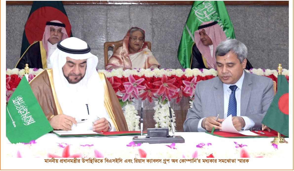
মাননীয় প্রধানমন্ত্রীর উপস্থিতিতে বিএসইসি এবং রিয়াদ ক্যাবলস গ্রুপ অব কোম্পানি'র মধ্যকার সমঝোতা স্মারক

মাননীয় প্রধানমন্ত্রীর উপস্থিতিতে গত ০৭/০৩/২০১৯ তারিখে বিএসইসি'র নিয়ন্ত্রণাধীন শিল্প প্রতিষ্ঠান জেনারেল ইলেকট্রিক ম্যানুফেকচারিং কোম্পানি লি: ও সৌদি কোম্পানি ইঞ্জিনিয়ারিং ডাইমেনশন লিঃ এর মধ্যে ১০০ (একশত) মিলিয়ন মার্কিন ডলার (৮৫০ কোটি টাকা) বিনিয়োগে Transformers, Lifts, Elevators, Precision Engineering Products উৎপাদন কারখানা তৈরীর লক্ষ্যে চুক্তি স্বাক্ষরিত হয়। সৌদি আরবের বাণিজ্য ও বিনিয়োগ বিষয়ক মন্ত্রী এবং অর্থ ও পরিকল্পনা মন্ত্রী'র নেতৃত্বে সৌদি