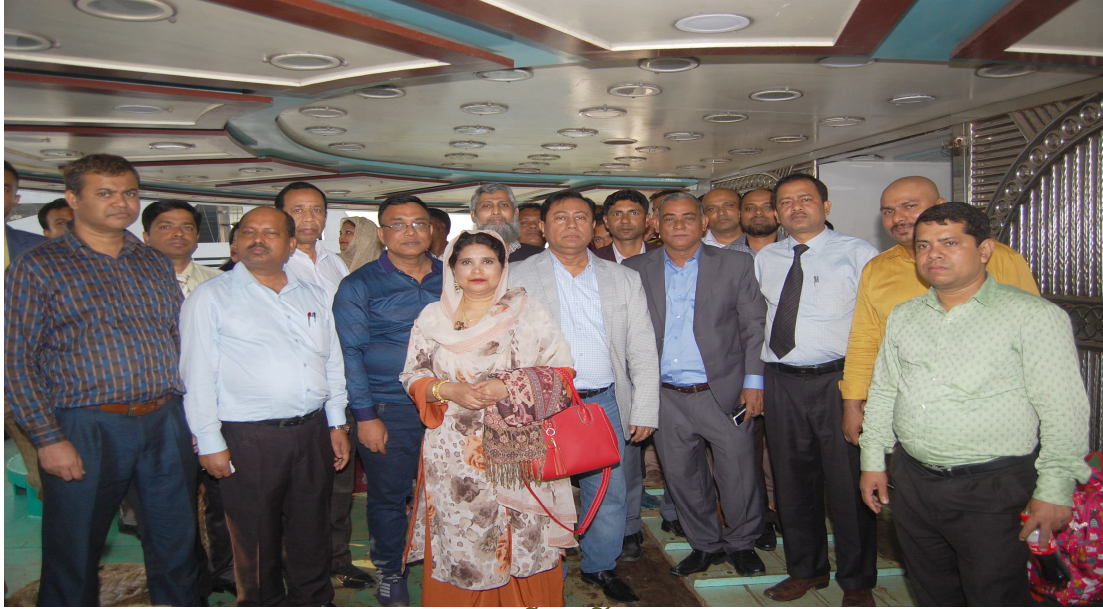
২০১৮ সালে অনুষ্ঠিত বার্ষিক বনভোজনে