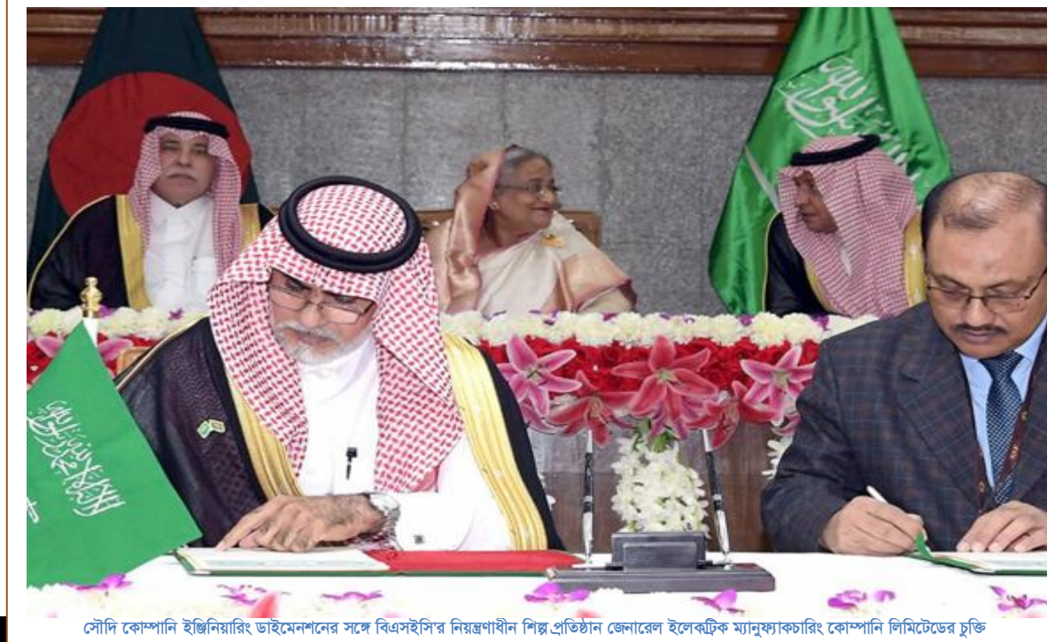
সৌদি কোম্পানি ইঞ্জিনিয়ারিং ডাইমেনশনের সঙ্গে বিএসইসি'র নিয়ন্ত্রণাধীন শিল্প প্রতিষ্ঠান জেনারেল ইলেকট্রিক ম্যানুফেকচারিং কোম্পানি লিমিটেডের চুক্তি

মাননীয় প্রধানমন্ত্রীর উপস্থিতিতে গত ০৭/০৩/২০১৯ তারিখে বিএসইসি'র নিয়ন্ত্রণাধীন শিল্প প্রতিষ্ঠান জেনারেল ইলেকট্রিক ম্যানুফেকচারিং কোম্পানি লি: ও সৌদি কোম্পানি ইঞ্জিনিয়ারিং ডাইমেনশন লিঃ এর মধ্যে ১০০ (একশত) মিলিয়ন মার্কিন ডলার (৮৫০ কোটি টাকা) বিনিয়োগে Transformers, Lifts, Elevators, Precision Engineering Products উৎপাদন কারখানা তৈরীর লক্ষ্যে চুক্তি স্বাক্ষরিত হয়। সৌদি আরবের বাণিজ্য ও বিনিয়োগ বিষয়ক মন্ত্রী এবং অর্থ ও পরিকল্পনা মন্ত্রী'র নেতৃত্বে সৌদি